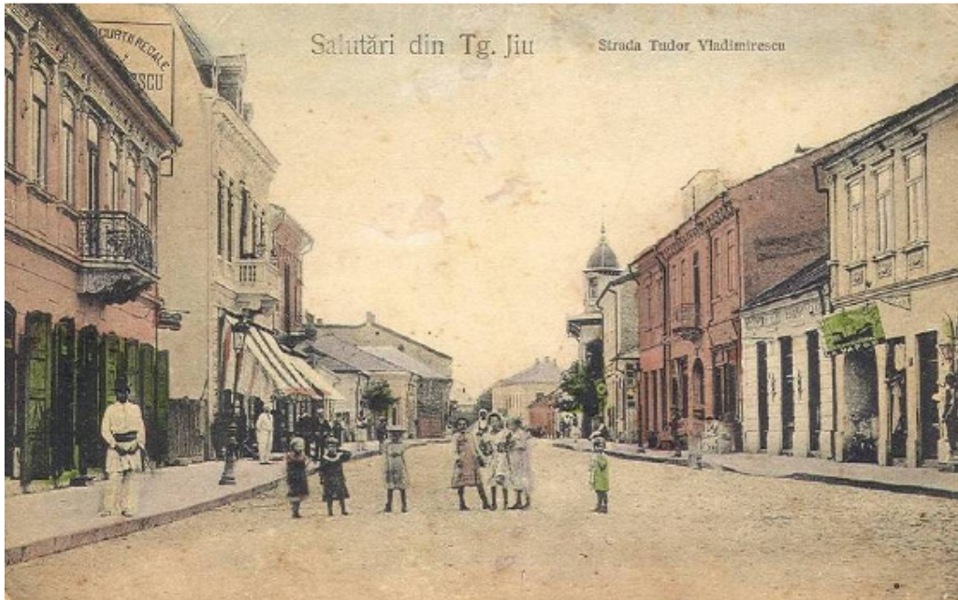
Motto: "Lucrurile nu sînt greu de facut. Greu este sa te pui in starea de a le face" – Constantin Brancusi